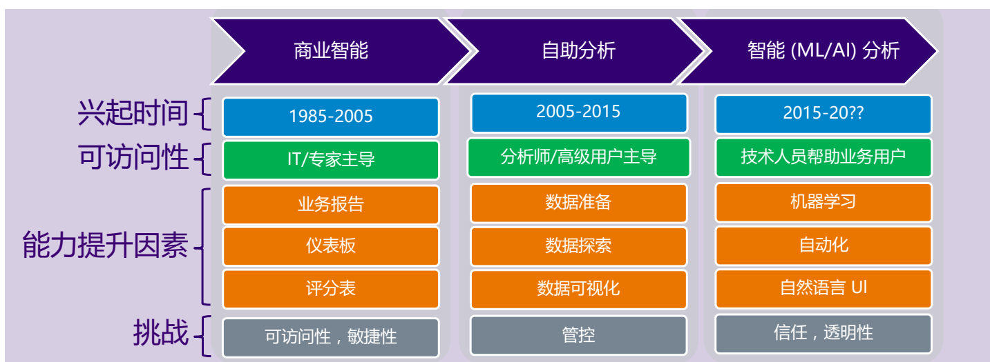
图 1：自助式分析的时代正让位于 ML 和 AI 辅助型智能分析的时代